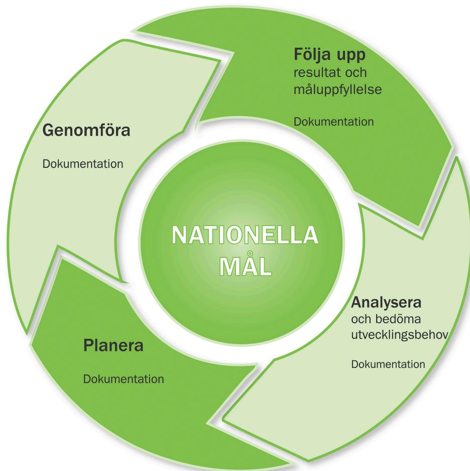
Figur 2. Skolverkets modell av kvalitetsarbetets olika faser

De olika faserna länkar i varandra och varje fas kräver i sig en analys. Den cykliska processen kan illustreras enligt följande modell. 186